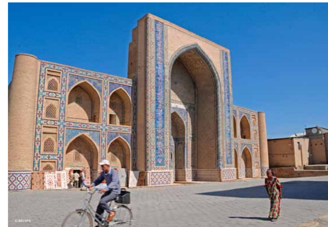
→ Bukhara, Ouzbékistan.

Les Routes de la Soie ont permis le transport de marchandises mais aussi les échanges interculturels de connaissances entre l'Orient et l'Occident.