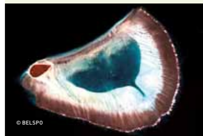
↑↑ Les récifs coralliens sont des écosystèmes parmi les plus riches au monde.