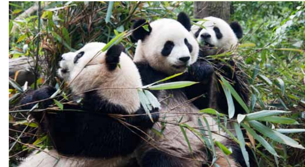
↑ Sanctuaires du grand panda du Sichuan

Le matériel de départ est une impressionnante collection de 850 images satellites acquises à trois périodes (1990, 2000 et 2010) par différents capteurs. Les forêts tropicales humides sont en effet très souvent recouvertes d'une épaisse couche nuageuse. Une vue complète du territoire au sol ne peut donc être obtenue qu'en combinant les données d'un très grand nombre d'images.