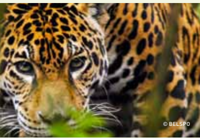
↑↑ La grande pyramide Maya de Calakmul.

Il fallait démontrer l'exceptionnelle valeur tant culturelle que naturelle du site.