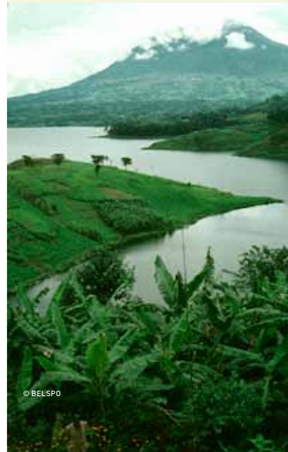
↑ Le paysage du parc national des Virunga.

La Coopération au développement belge et la Fondation des Nations Unies ont, avec d'autres partenaires, collaboré à un programme pour soutenir la préservation de la biodiversité dans les cinq sites du patrimoine mondial au Congo. Le programme s'étend de 2001 à 2013 et a une double stratégie. Par la « diplomatie de conservation », on renforce le soutien politique à la préservation: des contacts actifs avec des dirigeants politiques et militaires leur rappellent leurs obligations contraignantes par rapport à la Convention du patrimoine mondial. De plus, les gardiens des parcs des sites du patrimoine mondial reçoivent une aide dans l'exécution de leurs tâches de protection dans des circonstances difficiles et dangereuses, notamment par le biais de formations, ainsi que par l'amélioration de l'équipement et de l'infrastructure dans les parcs. La contribution belge au programme sert surtout à mettre en place et exécuter des plans d'action urgente dans les parcs les plus menacés. Ceci se fait en collaboration renforcée avec l'Unesco et l'ICCN.