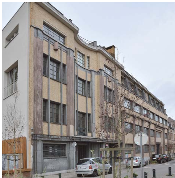
Ancien établissement La Magnéto belge, rue Marconi 121-123-125-127, Forest.