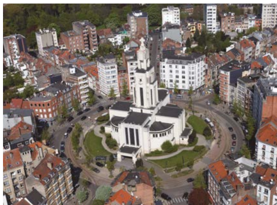
Quartier de l'Altitude Cent à Forest.