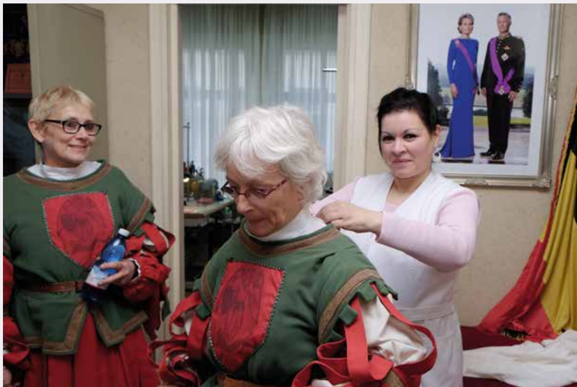
La couturière veille au bon déroulement des habillages.