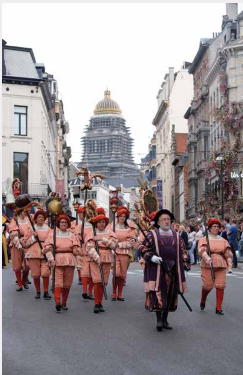
Les porteurs de Keersen quittent le Sablon.

RESPONSABLE DE LA CELLULE PATRIMOINE IMMATÉRIEL, DIRECTION DES MONUMENTS ET SITES