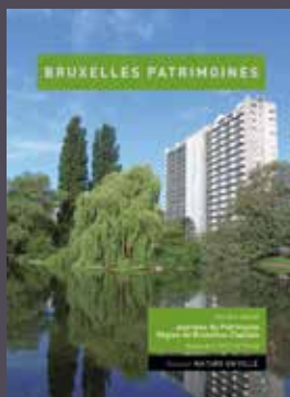
023-024 - Septembre 2017 Nature en ville