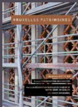
025 - Décembre 2017 Conservation en chantier