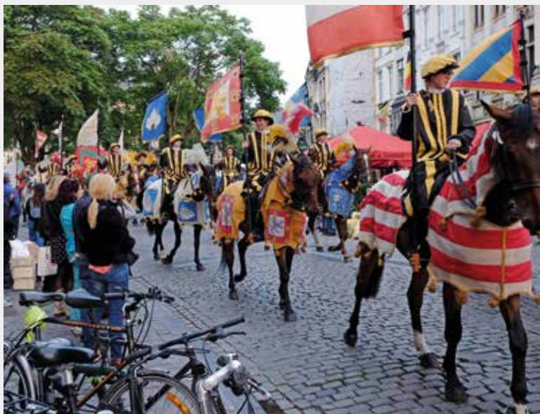
Les cavaliers de la police fédérale forment l'escorte impériale portant les bannières des possessions et titres (M. Vanhulst, 2016 © BUP/BSE).

Effectivement, en déclin au XVIII e siècle et n'ayant connu que deux représentations au XIX e siècle (1825 et 1855), l'Ommegang moderne fut recréé en 1928-1930 sur base des descriptions du cortège auquel Charles Quint avait assisté en 1549. Interrompu durant la Seconde Guerre mondiale, puis organisé annuellement depuis 1957, l'Ommegang actuel reste profondément inspiré de la version de 1930, tout en évoluant constamment, suivant les changements de la société. L'Ommegang perpétue la tradition des cortèges de l'ancien Brabant dans lesquels figuraient les gildes, les lignages, le magistrat urbain, le clergé, les