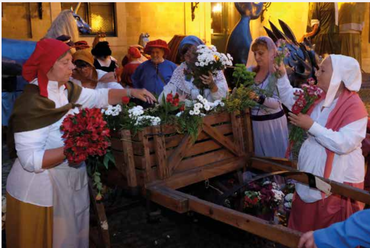
Le bon peuple de Bruxelles prépare sa charrette de fleurs.

dessins, datant pour la plupart de 1930. Chaque costume de la cour impériale a été réalisé pour être vu de très près et présente dès lors une grande qualité au niveau des dentelles, broderies, velours et satins. Quant aux drapeaux, chars, armes et autres accessoires, ils sont soigneusement entretenus, conservés et restaurés si nécessaire.