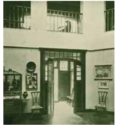
Fig. 8a Le hall central et le vestibule en 1898. Le garde-corps du premier étage est encore en place. À droite de la porte, la toile Champs aux coquelicots de V. Van Gogh [1889]. À gauche, un katagami et un meuble vitrine de van de Velde (extrait de L'Art décoratif. Revue internationale d'art industriel et de décoration , Paris, octobre 1898).