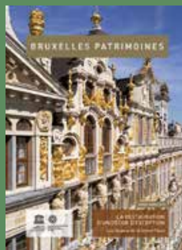
Hors-série - 2018 La restauration d'un décor d'exception