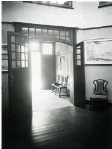
Fig. 13 Vue du vestibule depuis le hall, vers 1900. À droite de la porte, Dimanche, Port en Bessin de Seurat (1888).

Dans cet intérieur, dont la sobriété frisait le dénuement au vu des critères de l'époque, matières et couleurs sont les seuls ornements. Plusieurs papiers peints créés par Maria et Henry décorent le vestibule ( Dahlia ) (fig. 11), la salle à manger ( Ancolie ) (fig. 12a et b) et probable-