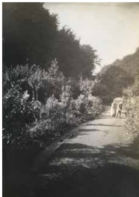
Fig. 17 Le jardin vu depuis le perron vers 1900. Sur le chemin, Maria, Henry et Nele van de Velde.

(fig. 16) 26 , sur l'ouverture d'une fenêtre supplémentaire dans la façade sud, au-dessus de la porte de la cuisine, et la construction d'un garage dans le jardin (1961) à l'endroit d'une cabane de jardin, côté rue Colonel Chaltin. L'extension de la maison en façade arrière abîme peu son image globale depuis le jardin et les locaux ajoutés permettent une flexibilité d'utilisation qui n'est pas à négliger — même si le beau volume de l'atelier a été surbaissé. Par contre, les interventions sur le second œuvre (en particulier sur les pignons) et sur les finitions ont modifié l'aspect de la maison de manière parfois significative.