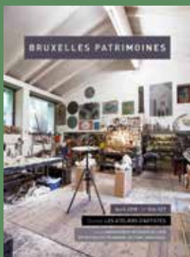
026-027 - Avril 2018 Les ateliers d'artistes