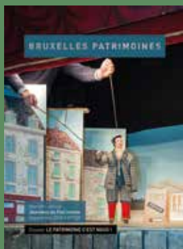
028 - Septembre 2018 Le Patrimoine c'est nous !