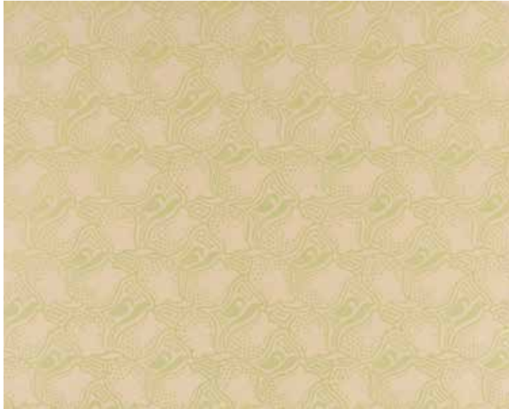
Fig. 12a Le papier peint Ancolie , créé par Maria et Henry van de Velde vers 1894 et utilisé dans le séjour- salle à manger du Bloemenwerf (© ENSAV – La Cambre, 3926 S).