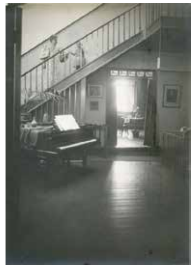
Fig. 8b Maria et Nele van de Velde dans l'escalier. Au fond, l'atelier de dessin 1900.