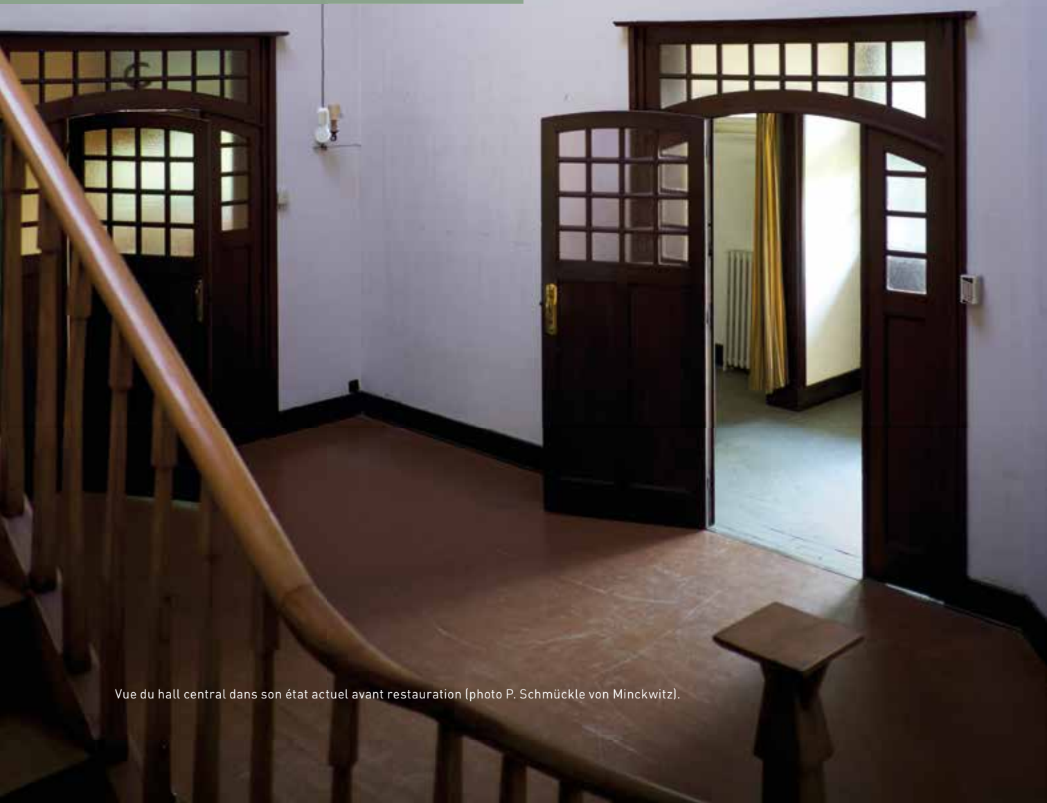
Vue du hall central dans son état actuel avant restauration.