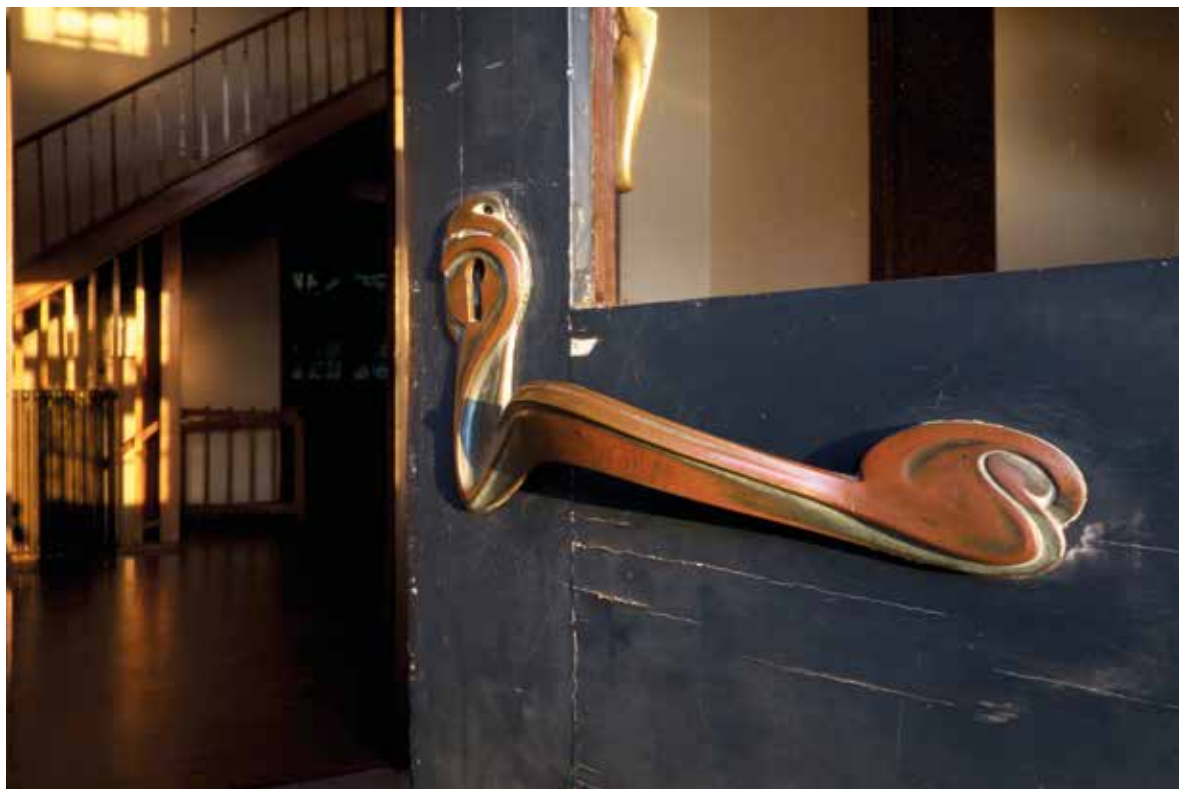
Fig. 14 Poignée extérieure de la porte d'entrée du Bloemenwerf.

(usage de murs doubles ventilés en façade) que de ventilation, d'isolation, d'hydraulique, de sanitaires, d'éclairage, d'utilisation de certains matériaux, etc. Cela en fait une maison assez atypique, présentant des qualités constructives et de confort peu courantes pour les habitations particulières de cette époque et, sans doute, encore performantes au regard des exigences actuelles.