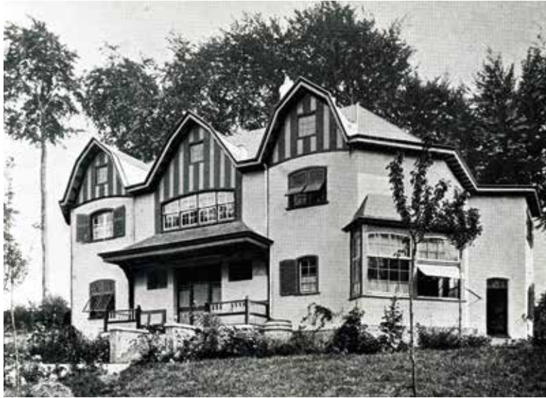
Fig. 3 Façade principale (ouest) en 1898 [extrait de L'Art décoratif. Revue internationale d'art industriel et de décoration , Paris, octobre 1898].