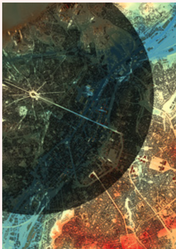
FIG. 5 Analyse-viewshed bidimensionnelle à l'aide du logiciel open source QGIS et l'extension Visibility Analysis avec un point de vue sur la couronne de la coupole de la Basilique nationale du Sacré-Coeur de Koekelberg avec une distance de vue de 5 km.

C. L'agentschap Digitaal Vlaanderen, manipulation par l'auteur du Modèle numérique de Surface (DSM) à l'aide du logiciel open source QGIS et l'extension Qgis2threejs.