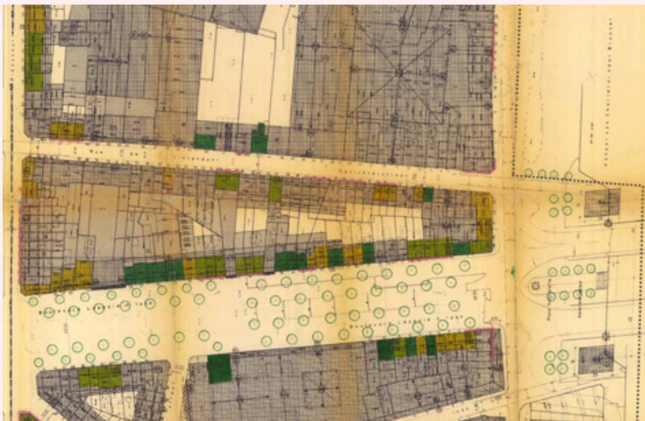
FIG. 1 Projet de plan de volume du Plan Particulier d'Aménagement 'Léopold II - C' de la commune de Molenbeek-Saint-Jean. Contrairement à des plans d'aménagement 'classiques' ce document concerne des informations tridimensionnelles (gabarit du bâti).

les objets visibles ou invisibles depuis un poste d'observation, mais aussi les objets qui constituent un obstacle visuel. Pour notre exploration, nous avons recouru en premier lieu à ce qui existe en termes d'informations, d'expériences, d'expertise et d'outils. En effet, un état des lieux des opportunités, possibilités, écueils et lacunes peut permettre, au besoin, de déterminer la nécessité de chercher de nouveaux outils et d'en cerner les défis.