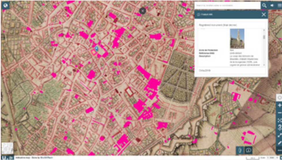
FIG. 2 Le portail BruGIS d'urban.brussels offre gratuitement un nombre important de informations cartographiques détaillées sur le Région bruxelloise.

moins prégnantes – de la morale et de l'éthique. Avec l'émergence des technologies numériques, on peut penser qu'un grand nombre de ces limites peuvent être surmontées. Ces nouvelles technologies garantissent en effet d'atteindre un niveau de précision et de détail inégalé. Elles suppriment certaines limitations propres à l'observateur et à sa position. Grâce à l'enregistrement électronique, les restrictions liées à l'espace physique interviennent de moins en moins. Les informations sont rendues disponibles de façon presque immédiate et dans le monde entier à un public de plus en plus large, et de plus en plus souvent sous la forme de visualisations saisissantes, toujours plus près du réel.