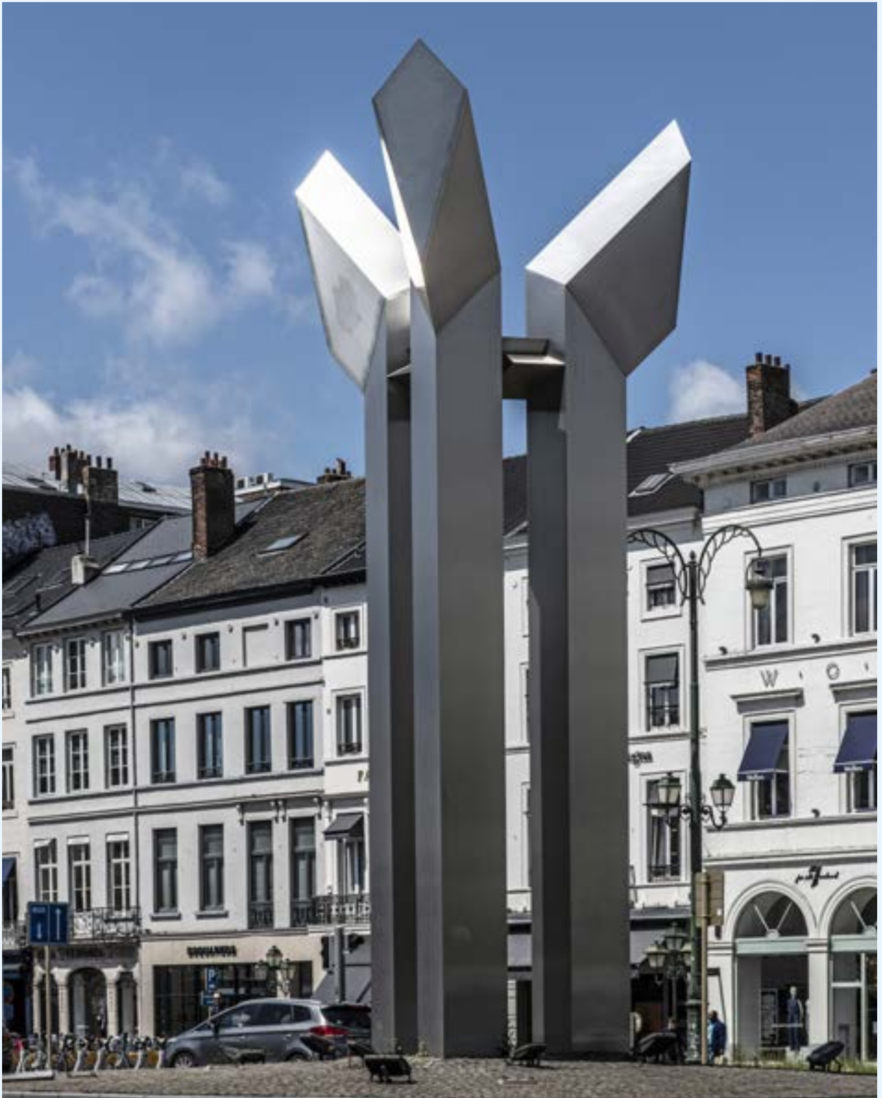
FIG. 1 Jacques Moeschal, Signe de lumière , sculpture à la porte de Namur