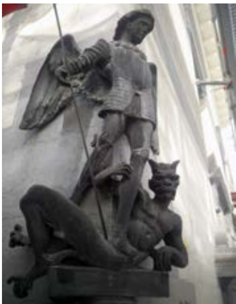
FIG. 1 Dinanderie de Saint-Michel en cours de restauration.