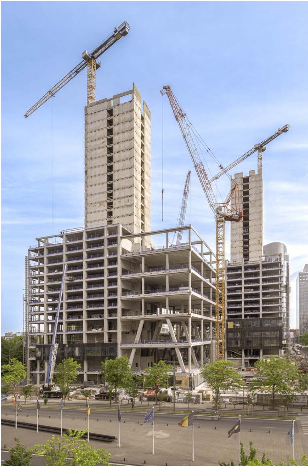
← ZIN, les anciennes tours WTC sont transformées en un ensemble multifonctionnel avec des bureaux, des logements, des commerces et un hôtel.