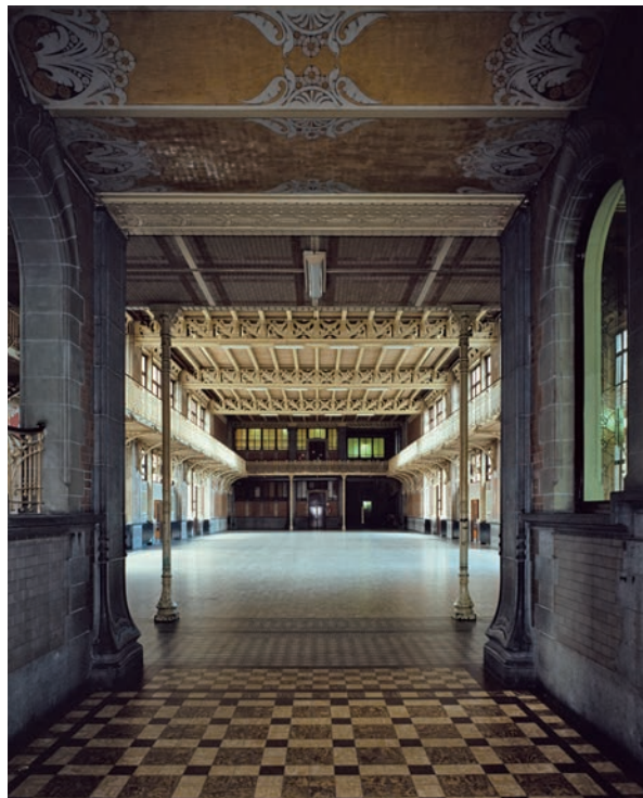
Fig. 3 &amp; 4

De groupe scolaire Josaphat, binnenzicht interieur.