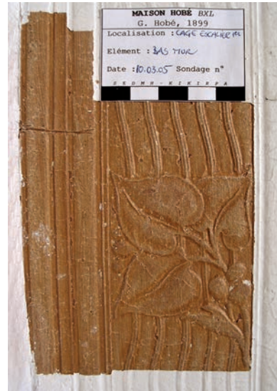
Fig. 5 & 6

Oorspronkelijk behangsel (in wit overschilderd) op de onderzijde van de muren van het trappenhuis.