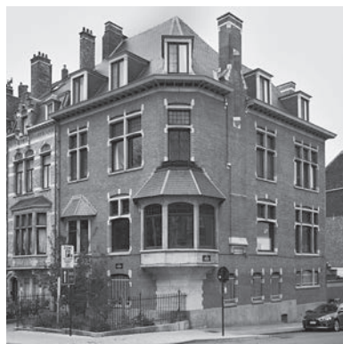
Fig. 1 Quaker House, Ambiorixsquare te Brussel.

In het kader van het restauratieproject waartoe de eigenaars het initiatief hadden genomen, vroeg de Directie Monumenten en Landschappen van het Brussels Hoofdstedelijk Gewest in januari 2005 aan het KIK om een stratigrafisch onderzoek te verrichten van de afwerkingslagen van de vertrekken op de benedenverdieping en de eerste verdieping. 2