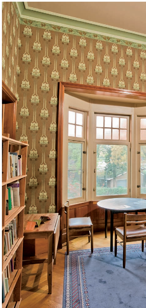
Klein salon na restauratie.