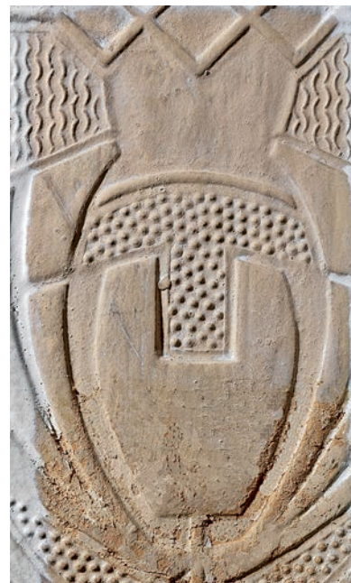
Fig. 7 & 8

Vrijmaking van de oorspronkelijke afwerking van het behangsel op de bovenzijde van de muren van het trappenhuis.