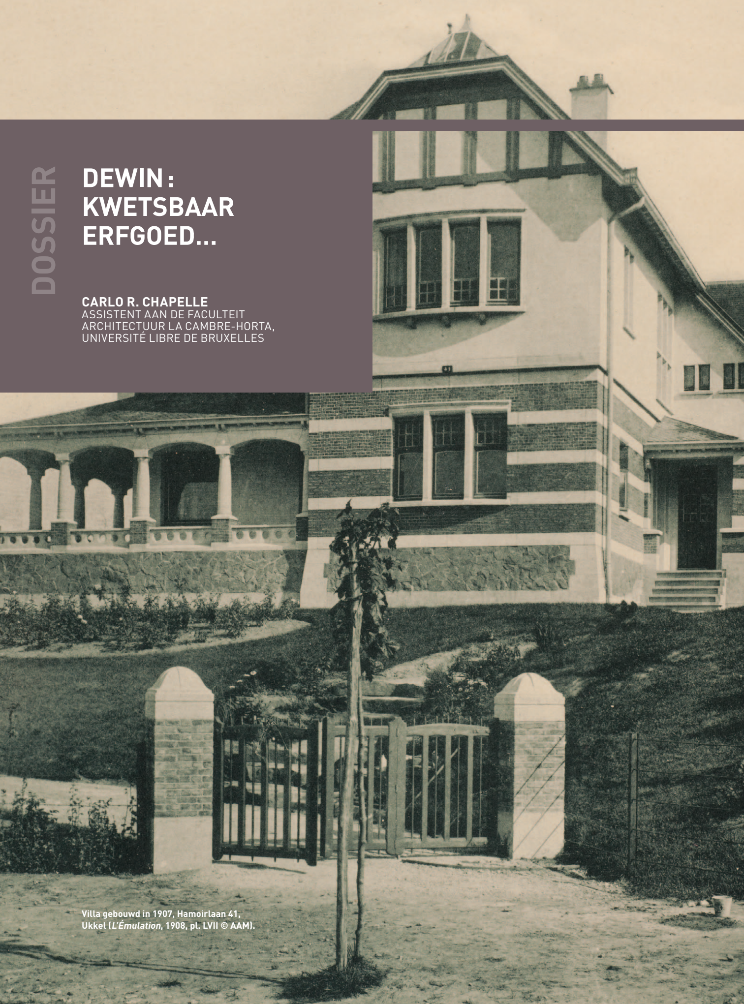
Villa gebouwd in 1907, Hamoirlaan 41, Ukkel ( L'Émulation , 1908, pl. LVII © AAM).

CARLO R. CHAPPELLE ASSISTENT AAN DE FACULTEIT ARCHITECTUUR LA CAMBRE-HORTA, UNIVERSITÉ LIBRE DE BRUXELLES