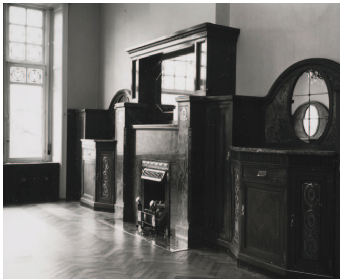
Afb. 8a en 8b

De verdwenen interieurs van het herenhuis, Molièrelaan 172, Elsene, 1910.