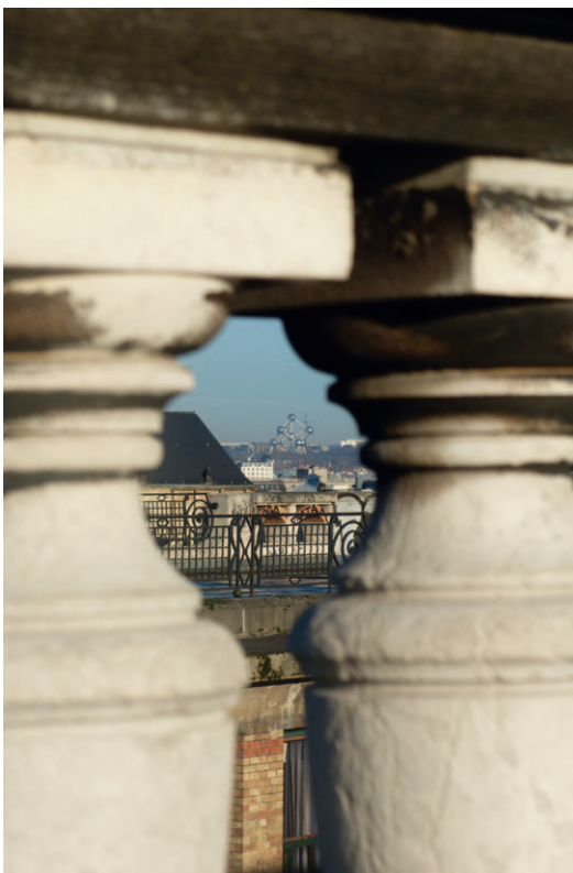
Thanh RODIERS École professionnelle Edmond Peeters Zicht vanaf het Poelaertplein, Brussel