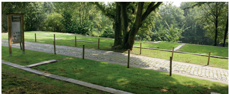
▼ Algemeen zicht op de evocatie van de Gallo-Romeinse villa