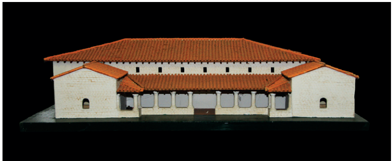
▲ Maquette van de Gallo-Romeinse villa van Jette in het Gemeentelijk Museum.

Dankzij deze sonderingen kon het grondplan van het hoofdgebouw aangevuld worden en opnieuw worden uitgezet. De funderingen werden weergegeven met blauwe steen. Om de bezoeker te informeren over de aanwezigheid van deze Romeinse hoeve werden onlangs, in samenwerking met het Departement Archeologisch Erfgoed van de Gewestelijke Overheidsdienst Brussel, verklarende panelen uitgewerkt die op de site werden geplaatst door Leefmilieu Brussel. SVB