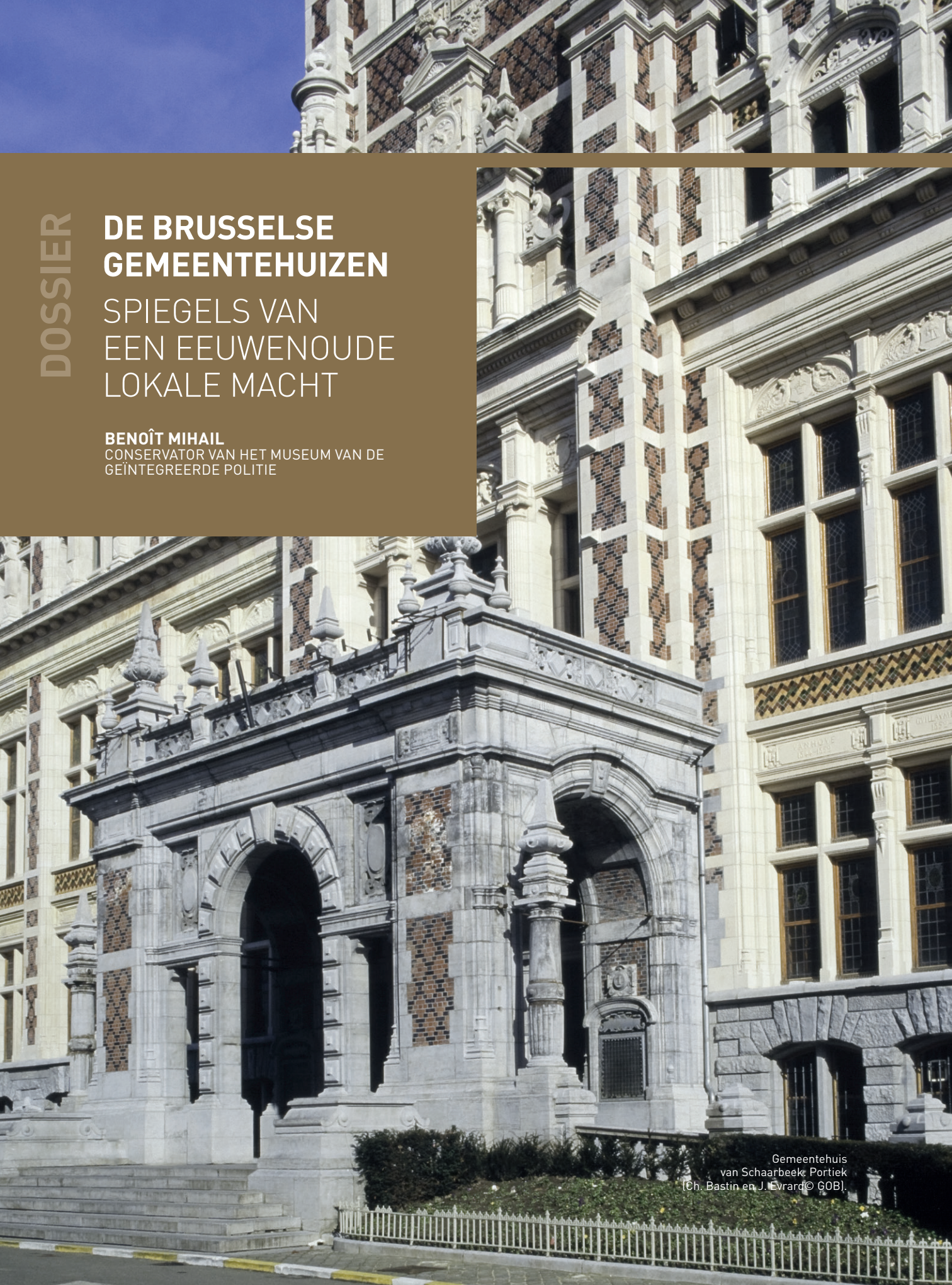
Gemeentehuis van Schaarbeek: Portiek (Ch. Bastin en J. Evrard © GOB).

CONSERVATOR VAN HET MUSEUM VAN DE GEÏNTEGREERDE POLITIE