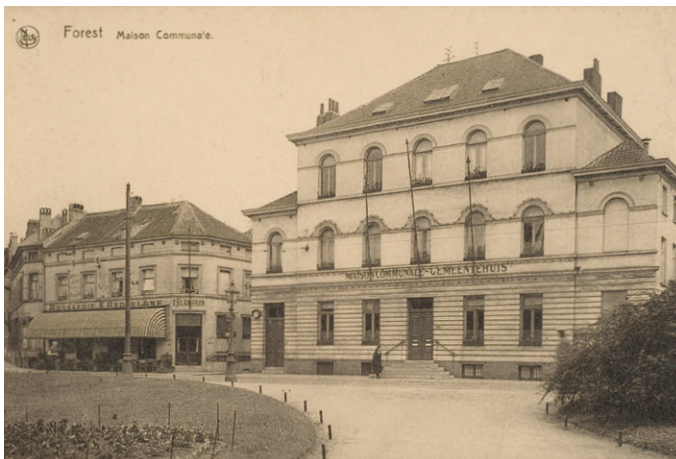
Afb. 5 Gemeentehuis van Vorst.