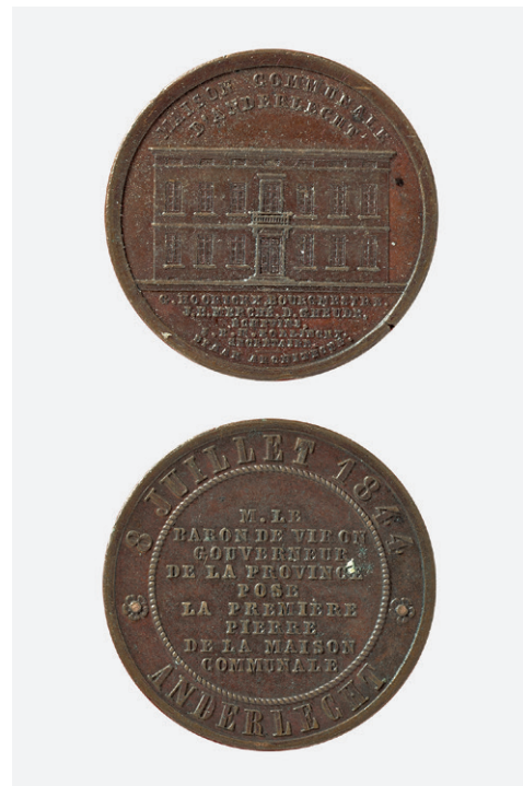
Afb. 7 Munten met de afbeelding van het gemeentehuis van Anderlecht.