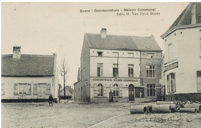
Afb. 6 Gemeentehuis van Evere.