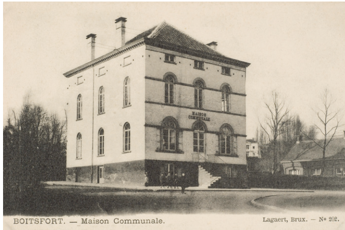
Afb. 3 Gemeentehuis van Bosvoord.