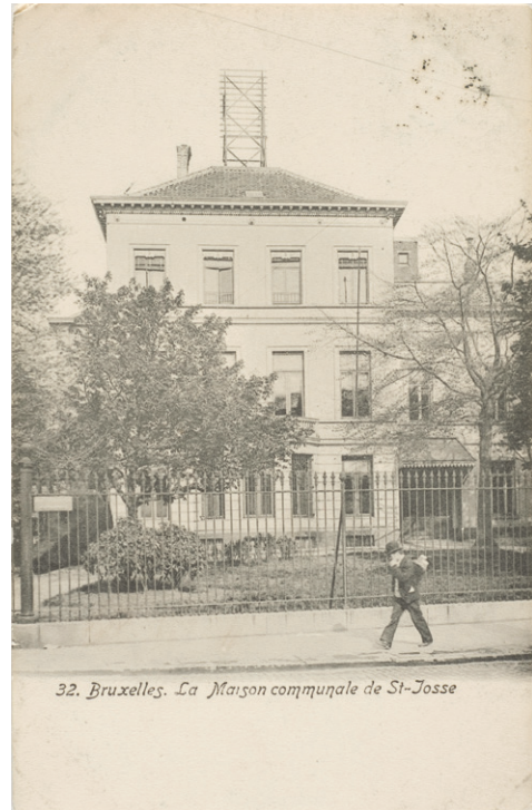
Afb. 4 Gemeentehuis van Sint-Joost-ten-Node.