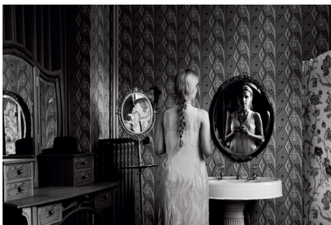
Patricia MATHIEU | Atrique-Huis, Schaarbeek arch. Victor Horta © Sofam 2016