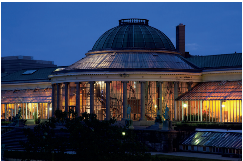
Anne ZED | Botanique, Sint-Joost-ten-Node