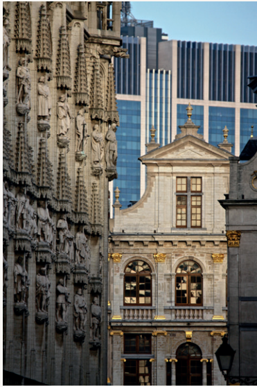
Alexandra BASTIN | Zicht vanuit de Stofstraat, Brussel