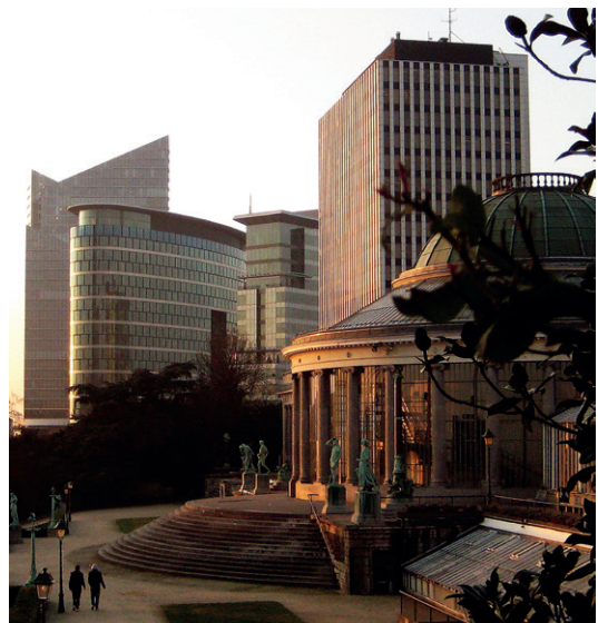
Marc LEGROS | Kruidtuin, Sint-Joost-ten-Node