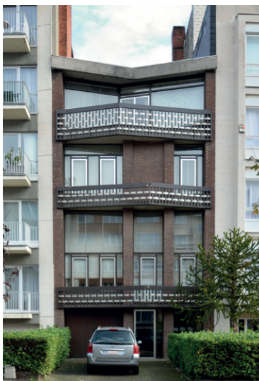
Huis Rombaut-Deplus (2014 © GOB).

De Directie Monumenten en Landschappen van het Brussels Hoofdstedelijk Gewest (DML) heeft recentelijk de inventaris van het architecturaal erfgoed van de gemeente Elsene afgerond met de publicatie van de wijken Solbosch en Boondaal op www.irisonument.be . Deze omvangrijke inventaris, aangevat in 2005, werd samengesteld door de cel Inventaris van de DML en omvat niet minder dan 338 straten waarin 4.325 gebouwen werden opgenomen, rijkelijk geïllustreerd met actuele en oude foto's, plannen en andere archiefdocumenten.