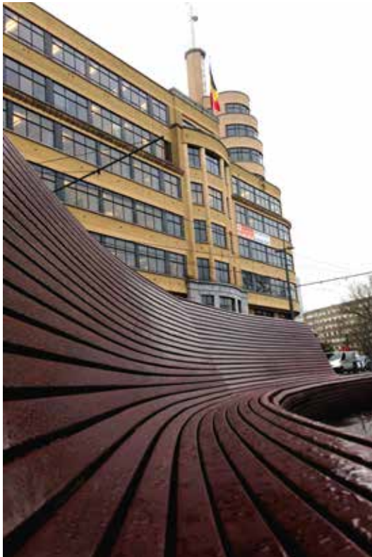
Nicolas FERRARD École Decroly Flageyplein, Elsene (arch. Joseph Diongre © Sofam, 2016)