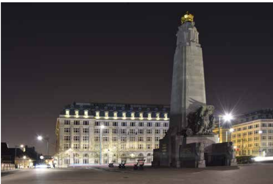
Ugo BARTOLOMUCCI Institut Redouté-Peiffer Poelaertplein, Brussel