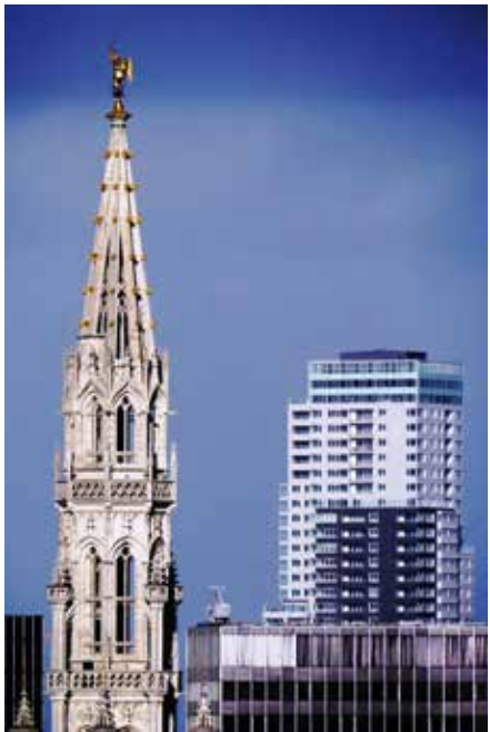
Roman GODHAIR École Decroly Zicht op de stad vanaf het Poelaertplein, Brussel