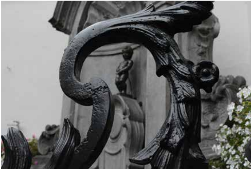
Dauids GOBA École européenne de Bruxelles 2 Manneken Pis, Brussel