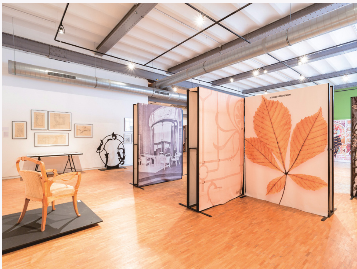
Tentoonstelling Flora's Feast, in het CIVA in 2016.