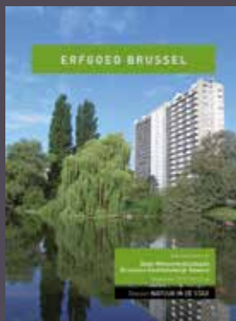
023-024 - September 2017 Natuur in de stad