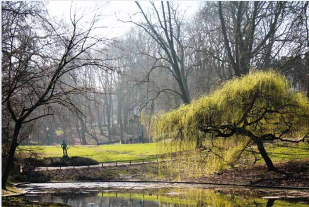
Josaphatpark te Schaerbeek. Internationaal fotografisch experiment met monumenten 2012 (C. Haigoune © BUP/BSE).