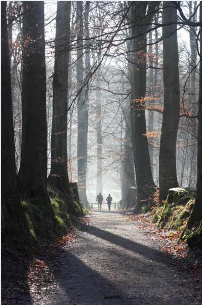
Het Zoniënwood. Internationaal fotografisch experiment met monumenten 2014.