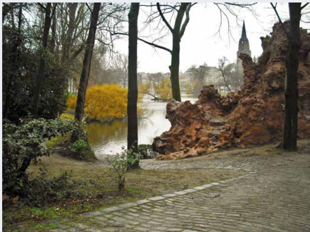
Vijvers van Elsene. Internationaal fotografisch experiment met monumenten 2017.

Het natuurlijke erfgoed maakt wezenlijk deel uit van de stedelijke structuur van Brussel zoals die in de 19de eeuw werd bedacht en in talrijke openbare parken vorm kreeg. Sommige ervan werden aangelegd op sites die van nature uit mooi waren, zoals het Josaphatpark of de vijvers van Elsene, andere werden uit het niets geconcipeerd, zoals het Woluwepark. De natuur werd aangelegd, nagebootst en geënceneerd.