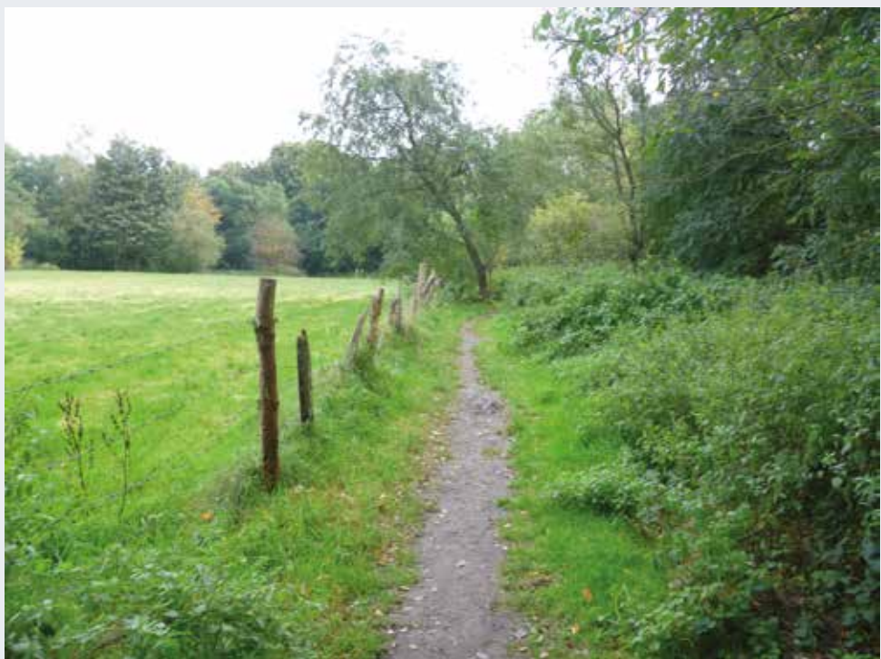
Het landschap van de Kauwberg te Ukkel (2016 © BUP/BSE).