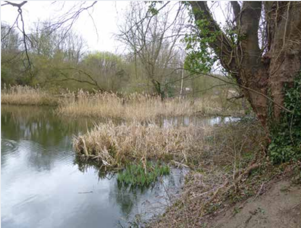
Het Moeraske strekt zich uit over drie gemeenten: Evere, Haren en Schaarbeek.

Ook de seminatuurlijke gebieden zijn een belangrijk facet van het Brusselse erfgoed. Het gaat om gebieden waarin een deels ongerepte en een deels aan banden gelegde natuur voor het publiek wordt opengesteld. Het milieu wordt er in stand gehouden omwille van zijn unieke ecologische kwaliteiten en kenmerken, bijvoorbeeld in het Moeraske. In sommige gevallen, zoals in natuurreservaat de Kauwberg, herinnert het gebied tevens aan het agrarische verleden van het gewest.