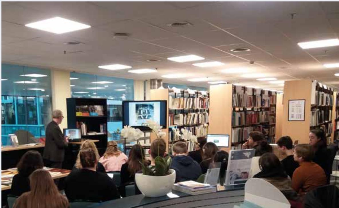
Vele bezoekers van het Documentatiecentrum zijn studenten. Op aanvraag organiseert het centrum ook seminars rond erfgoeddocumentatie.

ARCHITECTE EN KUNSTHISTORICA, VERANTWOORDELIJKE DOCUMENTATIECENTRUM BSE, DIRECTIE MONUMENTEN EN LANDSCHAPPEN