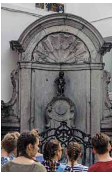
Afb.1 Manneken Pis , erfgoed én toeristische attractie.

Plaatsen met een hoge erfgoedwaarde oefenen een grote aan-