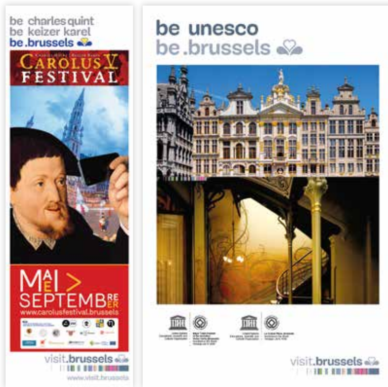
Fig. 2a en 2b

Twee voorbeelden van culturele promotiecampagnes: 2a) het Carolus Festival , een jaarlijks cultuurfeest; 2b) het werelderfgoed, een troef voor de promotie van het imago van Brussel.