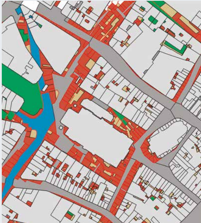
Afb.2 Kaart met de plaatsbepaling van de brouwerijen in de Sint-Gorikswijk (16de-19de eeuw), met de oude bedding van de Zenne (BUP/BSE, tekening D. Van Grieken, 2015).