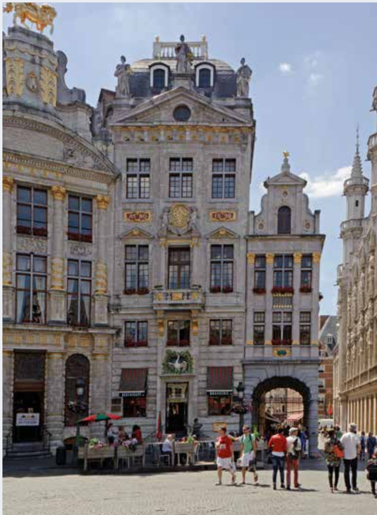
De huizen De Zwane en De Sterre na hun restauratie in 2014 (A. de Ville de Goyet © BUP/BSE).