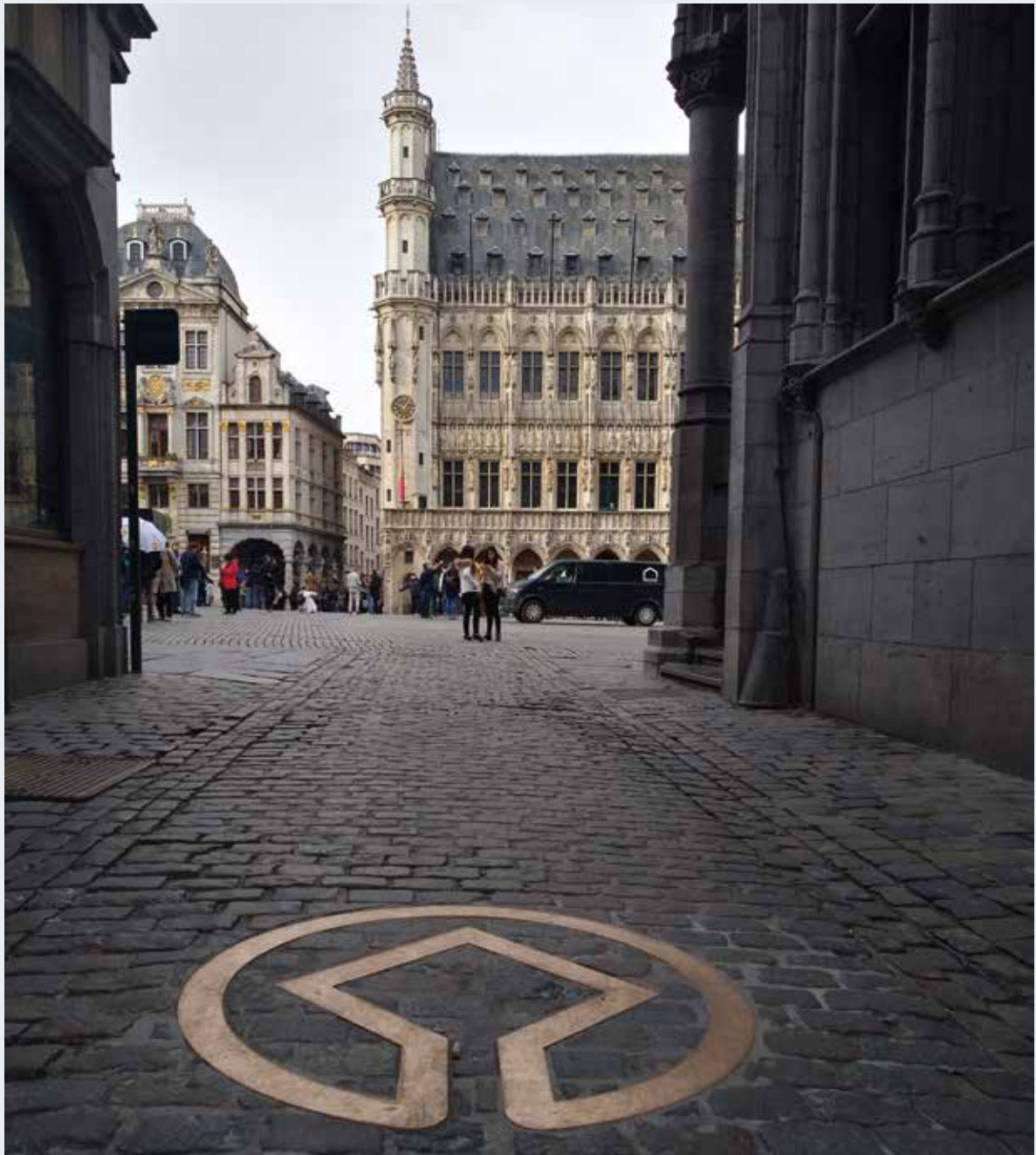
Onder andere in de Haringstraat, net voor men op de Grote Markt komt, werd het UNESCO-logo ingewerkt in de kasseibestrating

KUNSTHISTORICA, DIRECTIE MONUMENTEN EN LANDSCHAPPEN FOCAL POINT UNESCO - BRUSSELS HOOFDSTEDELIJK GEWEST