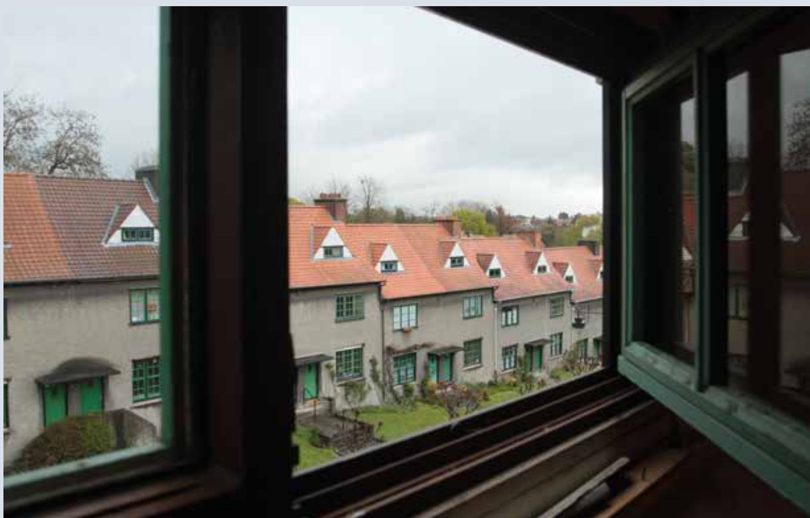
▲ De tuinwijk Le Logis in Watermaal-Bosvoorde, een eerste collectieve ervaring met de restauratie en renovatie van meer dan 300 woningen.