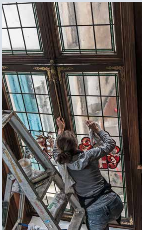
▼ Het Koninklijk Muziekconservatorium, Regentschapsstraat 30 in Brussel.