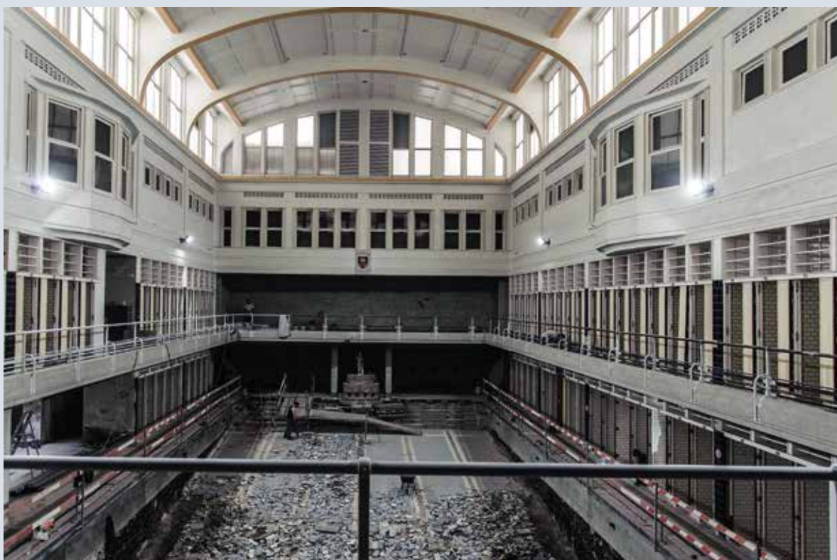
▼ De Baden van Sint-Joost, de renovatie van een art-decozwezbad, Sint-Franciscusstraat 23-27 in Sint-Joost-ten-Node (A. de Ville de Goyet, 2018 © BUP/BSE).