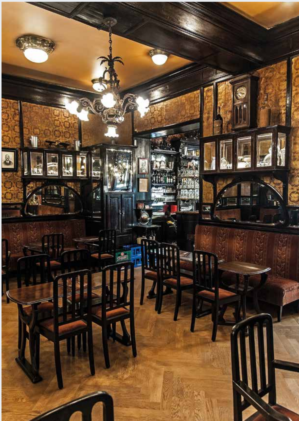
Café Le Cirio , Beursstraat 18 in Brussel.