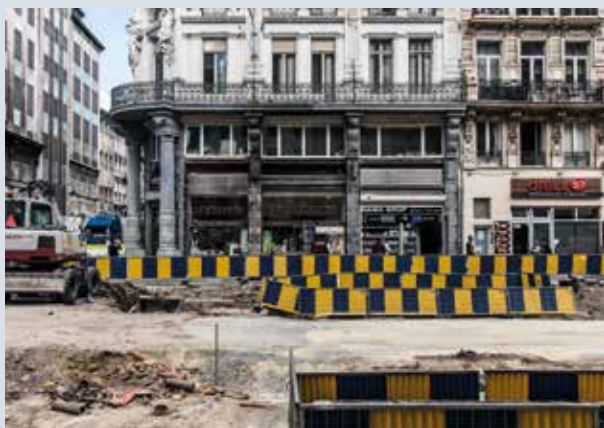
▲ De apotheek Neos-Bourse, Anspachlaan 59-61 te Brussel (A. de Villede Goyet, 2018 © BUP/BSE).

Van dossier tot bouwplaats. Enkele voorbeelden van dossiers gevolgd door de Directie Monumenten en Landschappen in het kader van de toepassing van de BWRO-wetgeving. Ze illustreren verschillende aspecten van de instandhouding van beschermde monumenten, landschappen en stedelijke gehelen in het Brussels Hoofdstedelijk Gewest.