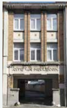
1924, 1932 - François Van Meulecomstraat 1 tot 5, Sint-Jans-Molenbeek