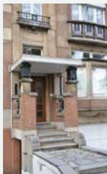
1927 - Wolvendaellaan 49, Ukkel