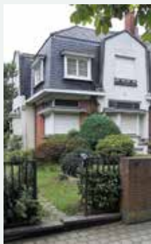
1935 - Koning-Soldaatlaan 97, Anderlecht