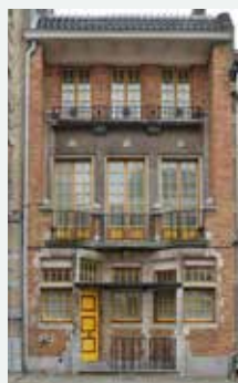
1924 - Victor Rousseaulaan 32, Vorst