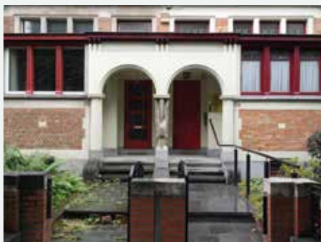
1925 - Limbourglaan 52, 54, Anderlecht