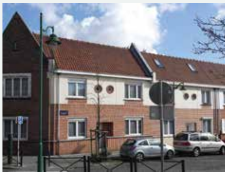
1938 - Akkoordstraat 2, 4, 6, 8, 10, 12, Eugène Degorgestraat 7, 34, 36, 38, 39, 40, 42, Leeuwerikslieplaats 2, 4, Melodiestraat 2, 4, 6, 8, 10, 12, 14, 16, 18, 20, 22, 24, 26, 28, Sint-Jans-Molenbeek