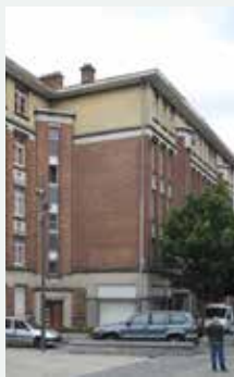
1932 - Liverpoolstraat 12 tot 22, Sint-Jans-Molenbeek