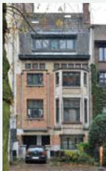
1931 - Albertlaan 205A, Vorst