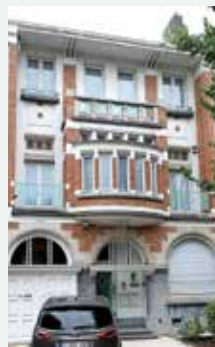
s.d. - Paul Jansonlaan 74, Anderlecht