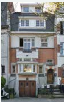
1931 - Jupiterlaan 113, Vorst