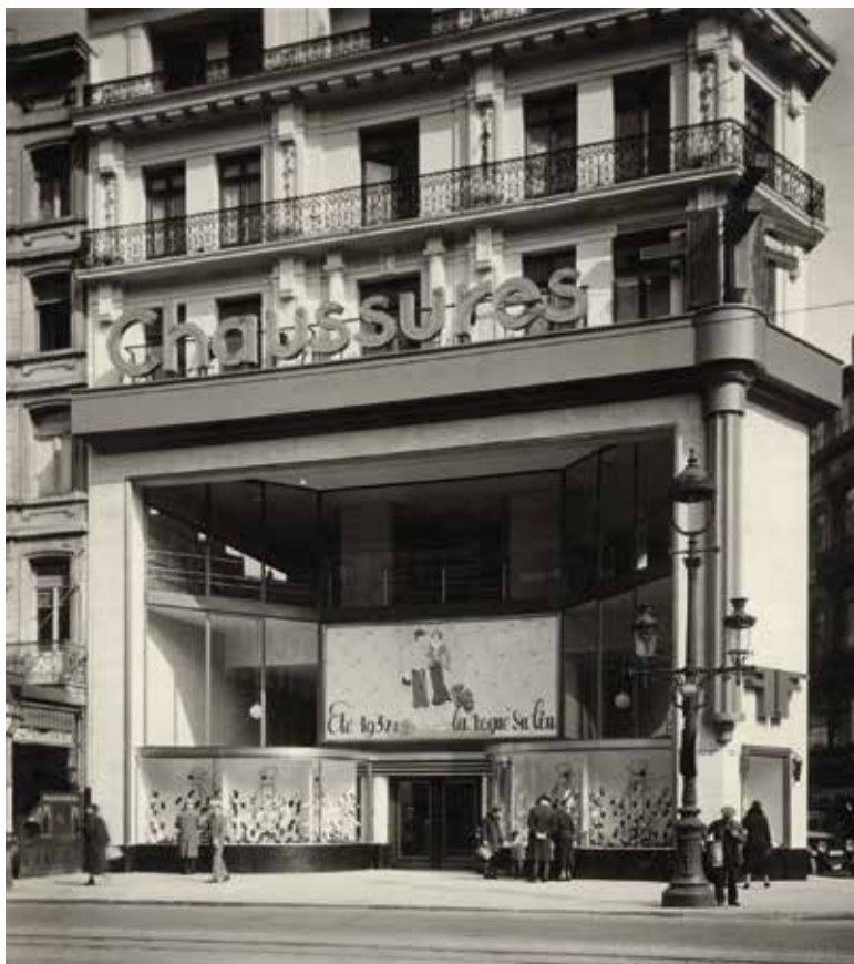
Afb.14 Schoenwinkel Frans Fils in de Anspachlaan 106 te Brussel, ca. 1937 (© verz. AAM / Fondation Civa Stichting Brussels).

nen 14 (afb. 16). Het hogere linkerdeel werd toegevoegd in 1940 en bevatte de opslagplaatsen. Dit geheel werd in 2006 omgebouwd tot een appartementsgebouw met kunstgalerij, waardoor het interieur en de binnengevels voor een groot deel verloren gingen. De opmerkelijke hoofdgevels in art-decostijl werden echter bewaard. Het eerste gebouw bestaat uit drie delen, waarvan het centrale gedeelte breder is met een doorgang op de benedenverdieping en 11 smalle, verticale vensteropeningen op de verdieping. De twee zijdelingse delen worden bekroond door een trapvormig fronton en hebben een trapezoidale erker op de verdieping. De hoofdingang met portiek en luifel bevond zich in het rechterdeel. De frontons en het hoofdgestel van de centrale muuropeningen werden voorzien van de opschriften FF en Chaussures . Het tweede gebouw van vijf bouwlagen wordt geritmeerd door zes monumentale kolommen waarvan de centrale delen een fronton vormen, hiertussen bevinden zich doorlopende metalen glasramen.