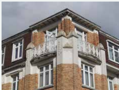
1921 - Pierre-J. Demessemaeckerstraat 2, 33, 35, 36 Klimopstraat 2, 28, Osseghemstraat 88, 90, 92, St-Jans-Molenbeek