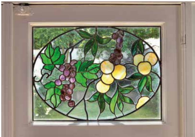
Afb. 5a en 5b

Glas-in-loodramen in de Timmermansstraat 66, Vorst.