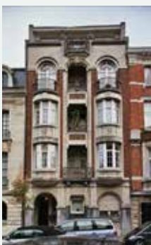
1924 - Jean-Baptiste Meunierstraat 26, Elsene