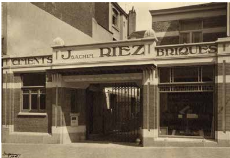
Afb.15 Loods in de Alsebergse steenweg 180 te Vorst, 1921.

Bij de opmaak van de inventaris van het bouwkundig erfgoed van de Hoogte Honderdwijk in Vorst in 2010-2012 en de visuele snel-inventarisatie, uitgevoerd tussen 2014 en 2016 op het grondgebied van het Brussels gewest, werd een groot aantal gebouwen van François Van Meulecom gerepertorieerd. Dit oeuvre blijkt stilistisch zeer coherent en herkenbaar door de grote zorg die werd besteed aan zowel de creativiteit en de details van het gebouw, als aan de intimiteit en het comfort van de bewoners. Door de tientallen toevoegingen van dit architecturaal oeuvre aan bovenstaande inventaris wordt de aandacht gevestigd op hun belang en wordt er gepleit voor