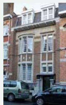
1922 - Landhuisjesstraat 156, Ukkel