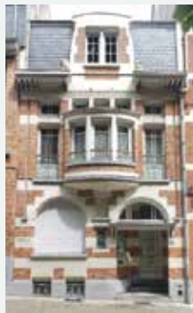
1924 - Victor en Jules Bertauxlaan 14, Anderlecht