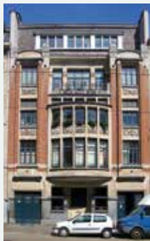
1924 - Terkamerenlaan 47-49, Brussel Uitbreiding Zuid