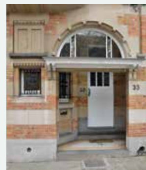
1924 - Victor Rousseaulaan 33, Vorst