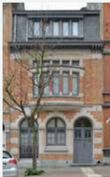
1924 - Victor Rousseaulaan 11, Vorst