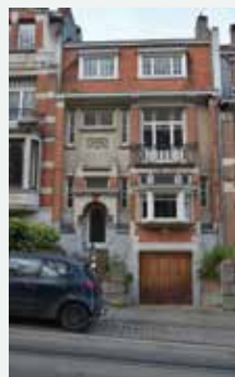
1926 - Wolvendaellaan 51, Ukkel