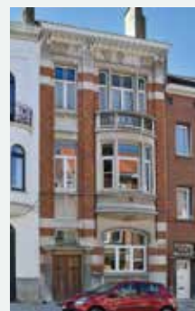
1922 - Steekspelstraat 24, Vorst