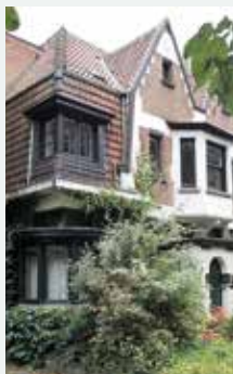
1927 - Koning-Soldaatlaan 30, Anderlecht