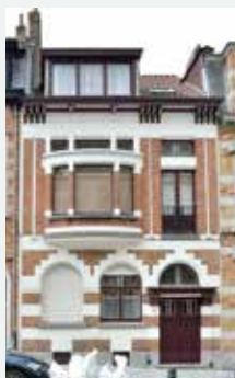
1925 - Schermstraat 28, Vorst