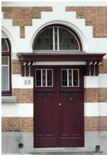
Afb. 4a en 4b

Ingangdeuren met loggia en/of luifel. 4a: Victor en Jules Bertauxlaan 14 te Anderlecht en 4b: Schermstraat 28 te Vorst.