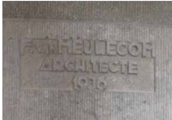
Afb. 2a en 2b

Twee voorbeelden van gesigneerde gevelstenen, links in de Steekspelstraat 30 te Vorst (1922) en rechts op het Constantin Meunierplein 14 te Vorst (1936).