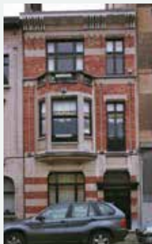
1924 - Jean-Baptiste Colynsstraat 110, Elsene