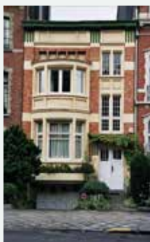
1922 - Jules Lejeunestraat 55, Elsene