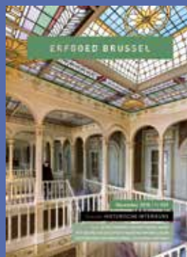
029 - December 2018 Historische Interieurs