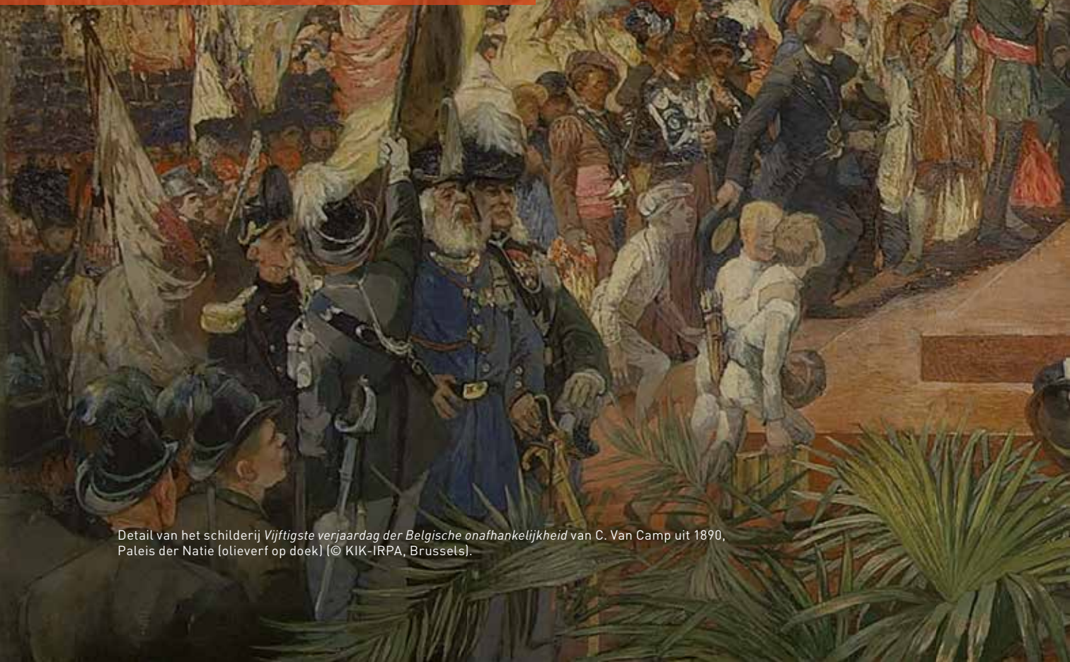
Detail van het schilderij Vijftigste verjaardag der Belgische onafhankelijkheid van C. Van Camp uit 1890, Paleis der Natie (olieverf op doek).