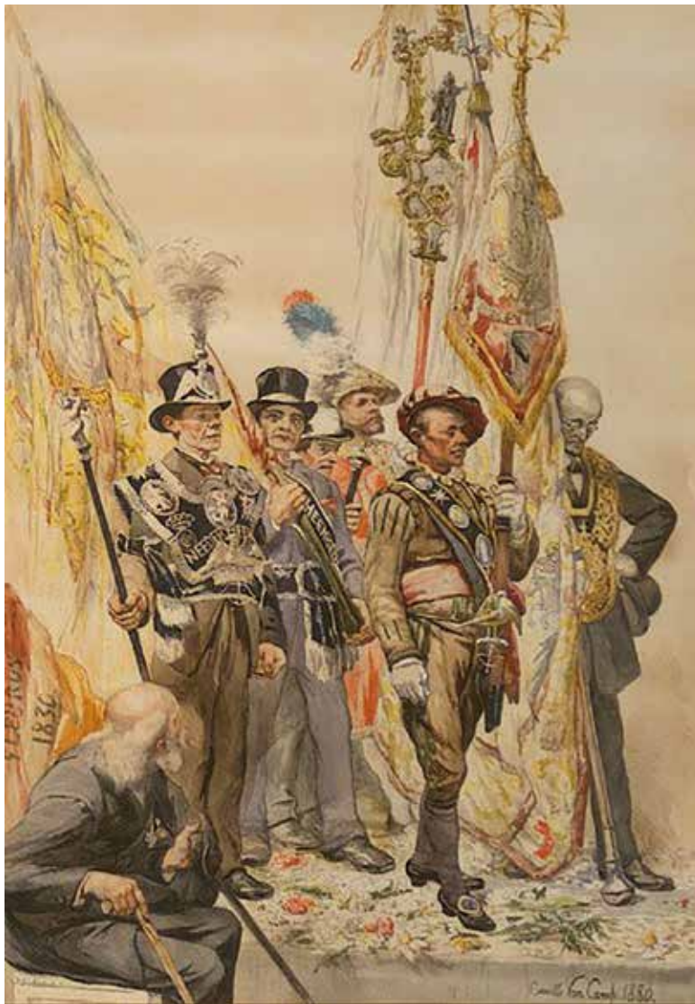
Afb. 13 C. Van Camp, Souvenir de la fête patriotique du 16 août 1880 , 1880, [aquarel] privéverz.

In mei 1881, naar aanleiding van de tentoonstelling van de Société royale des Aquarellistes , stelde Van Camp zijn grootse project voor aan een ruim publiek aan de hand van een aquarel die opnieuw een onderdeel van de finale compositie uitlichtte 15 . De deelcompositie, getiteld Souvenir de la fête patriotique du 16 août 1880 (afb.13), verbeeldt een groep van vijf schutters in gildekostuums met vaandels en opsmuk. De koning van het schuttersgild, overladen met medailles, draagt het vaandel van Needer-Heembeek