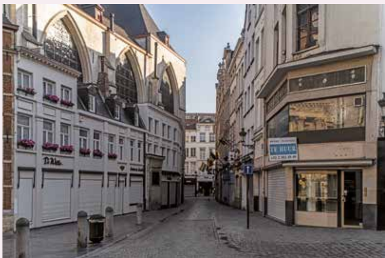
Afb. 2b Kleine Boterstraat, 2012

gevel tot gevel. Er werden traditionele materialen gebruikt: de zones die overeenstemden met de vroegere trottoirs werden uitgevoerd in vlakke kasseien van Maaszandsteen en de centrale zone van de weg in gezaagde langwerpige porfierkas-