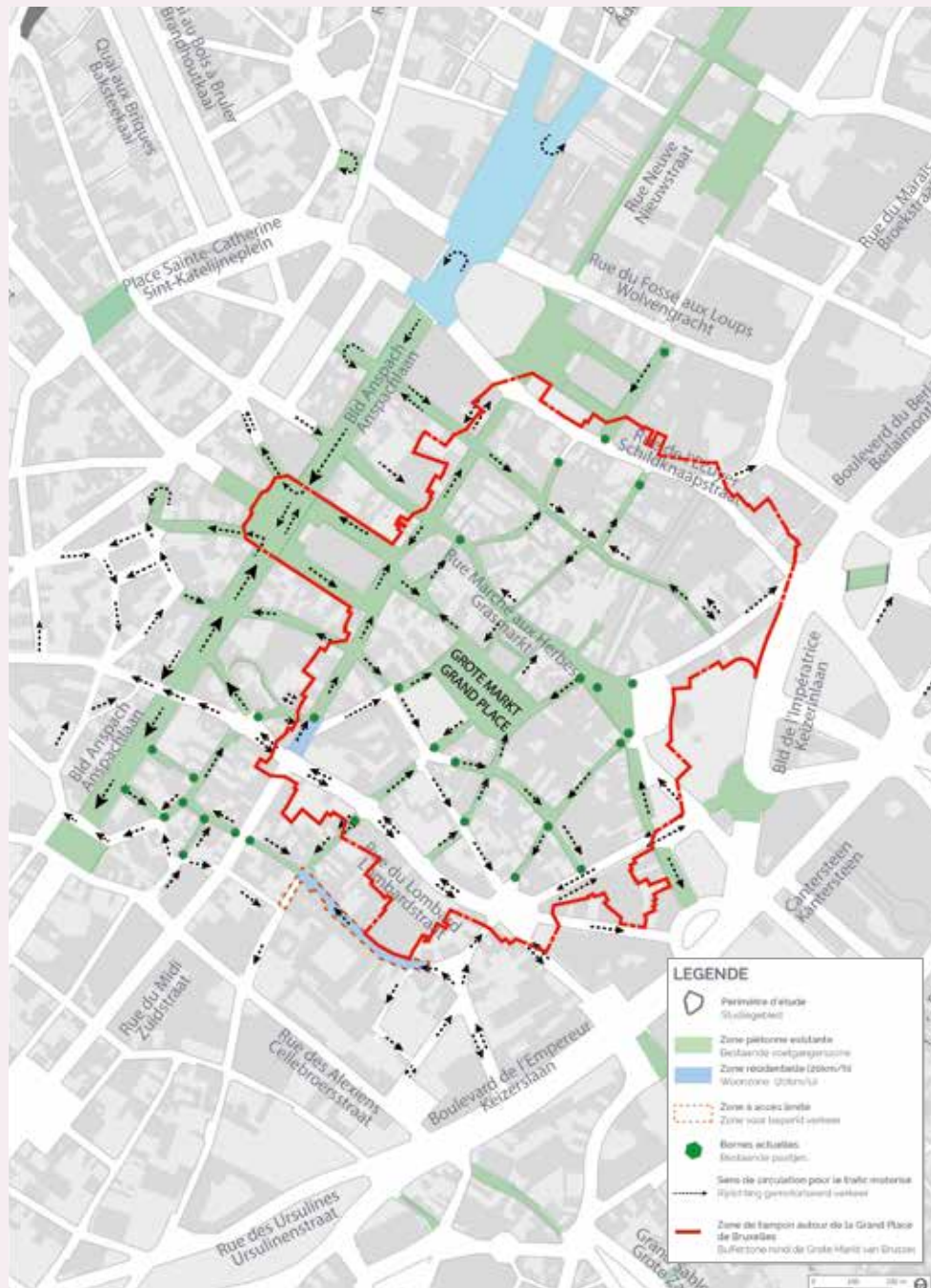
Afb. 1 De voetgangers- zone en de Unesco-zone in het centrum van Brussel.

ARCHITECTE, BEHEERDER VAN DE UNESCO-ZONE VAN DE GROTE MARKT STAD BRUSSEL, DEPARTEMENT OPENBAAR ERFGOED, CEL HISTORISCH ERFGOED