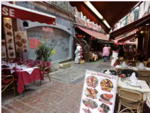
Afb. 5a, 5b en 5c

Materialentest, Beenhouwersstraat, 2014