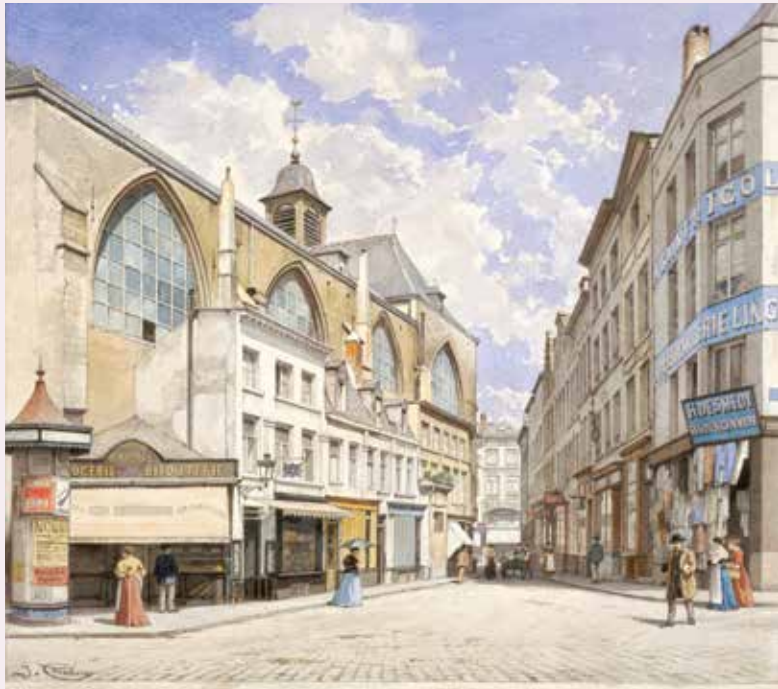
Afb. 2a Kleine Boterstraat, aquarel van Jacques Carabain, 1897, (© SAB, BIB 18012)

Bij de wegenwerken in de voetgangerszone werd geopteerd voor een typisch Brusselse bestrating, namelijk de kassestraat. Er werden echter aanpassingen aangebracht om te beantwoorden aan de hedendaagse eisen inzake mobiliteit; omvormen van straten tot voetgangerszone, fietspaden, toegang voor personen met beperkte mobiliteit (PBM). De trottoirs werden geëffend, om een publieke ruimte op eenzelfde niveau te creëren van