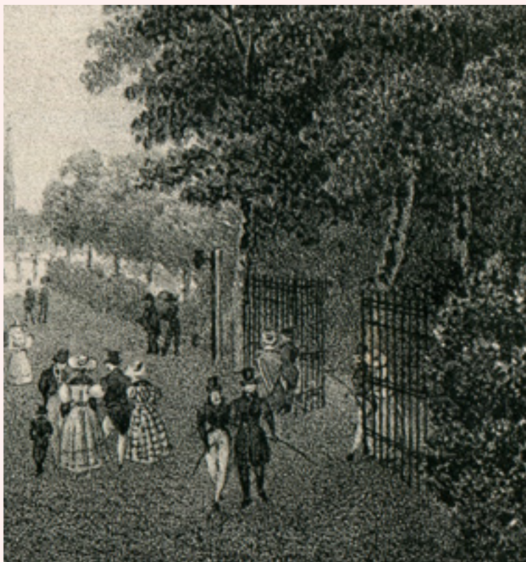
AFB. 3A Plein voor het Koninklijk Paleis in Brussel. Detail uit lithografie naar een tekening van Sturm [1829?], uit een bundel met anonieme litho's. (© privéverzameling). Rechts ziet men de haag die de grens van het park aangeeft.

neerd zijn. Afbeeldingen van die tijdelijke architectuur geven ons een idee van het effect dat ze sorteerde (AFB. 1).