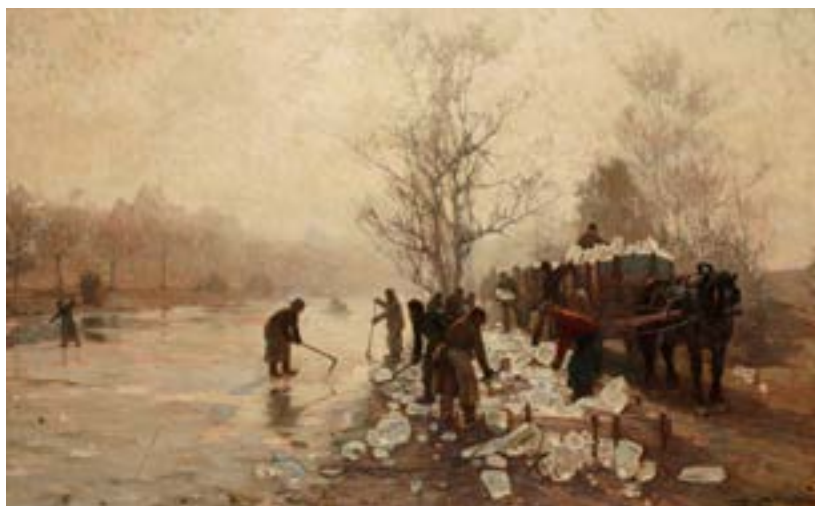
AFB. 3 Henry Seben, Het ijsvrij maken van de vijvers van Elsene , z.d., olieverf op doek, Museum van Elsene, (CC0493 © Museum van Elsene)

ontstaan door het dempen van het noordelijke deel van de grote vijver en het overwelfen van de Maalbeek, die ontspringt bij de Ter Kamerenabdij. Het gebied werd gebruikt voor brouwerijactiviteiten, maar raakte al snel verstedelijkt. Een nieuwe kerk werd gebouwd, niet in het centrum, maar aan de rand van het dorp. De neogotische Heilig-Kruiskerk, opgetrokken in rode baksteen, werd in 1865 voltooid.