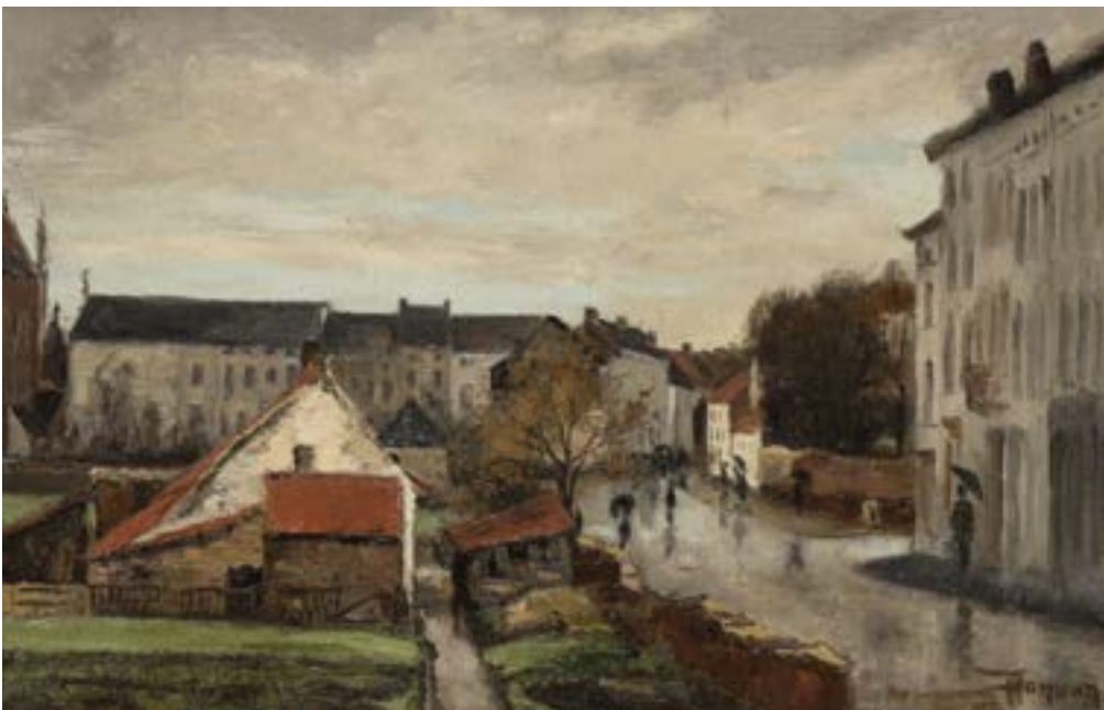
AFB. 9 Théodore Hannon, Sans Soucistraat , 1877, olieverf op doek, Museum van Elsene, (CC0242 © Museum van Elsene).