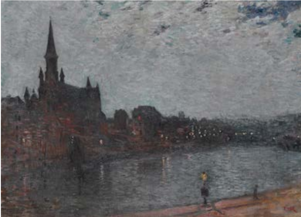
AFB. 4 Théo van Rysselberghe, Heilig-Kruiskerk of Voorstad om middernacht, 1886 , olieverf op doek, Museum van Elsene, (CC1653 © Museum van Elsene).

gebied rond de vijver rechts is nog onbebouwd, terwijl links op de achtergrond de contouren van huizen te zien zijn. In gedempte tinten, een camaieu van bruin en beige, evoceert de schilder het harde labuur van de arbeiders, die verdwaald zijn in de winterse mist. Alle idealisering van het plattelandsleven blijft achterwege in dit werk.