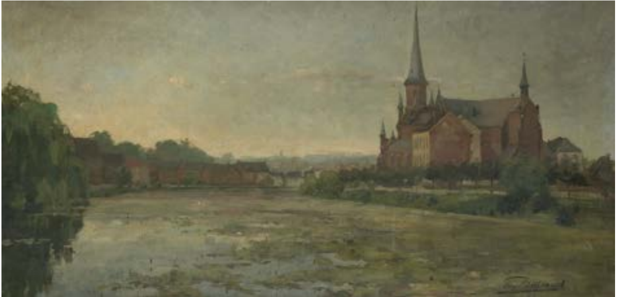
AFB. 1 Eugène Bertrand, Heilig-Kruiswijk , 1887, olieverf op doek, Museum van Elsene (CC0643).

D e tijdelijke sluiting van het Museum van Elsene 1 voor renovatiewerkzaamheden in 2018 bood de gelegenheid om de vaste collectie grondig onder handen te nemen. Er werd een uitgebreide inventaris opgesteld. Daarbij werd gebruik gemaakt van een database van urban.brussels, die het mogelijk maakte om alle werken makkelijker te raadplegen. Tijdens de inventarisering werden vergeten of ondergewaardeerde werken herontdekt, in het bijzonder schilderijen die de gemeente Elsene afbeelden. Van die laatste zijn er niet veel in de collectie: het museum was immers nooit bedoeld als lokaal museum en richtte zich dus niet specifiek op de geschiedenis van de gemeente.