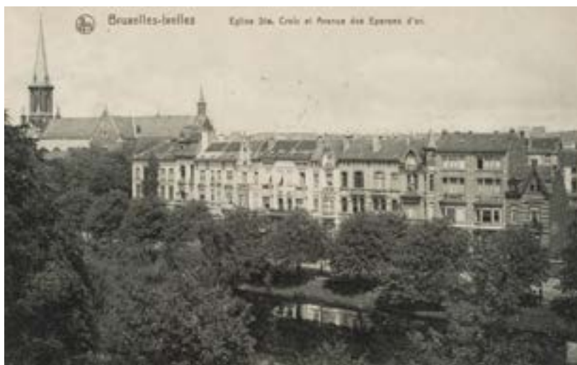
AFB. 2 Heilig-Kruiskerk en de Guldensporenlaan, postkaart (verz. Belfius Bank - Académie royale de Belgique © ARB - urban.brussels, DE38_344).