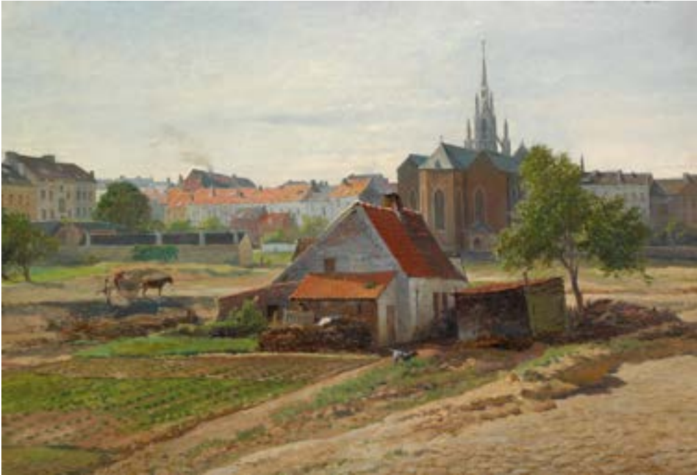
AFB. 8 Charles de Ligny, Sint-Bonifaaswijk , 1877, olieverf op paneel, Museum van Elsene, (CC0305 © Museum van Elsene).