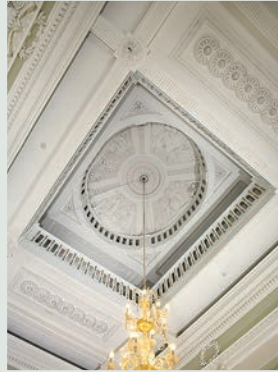
Zicht op de koepel van de grote staatsiesalon op de eerste verdieping (2012 © KIK-IRPA, Brussel).