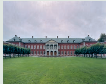
Gebouw van de huidige universitaire faculteit Landbouwwetenschappen (1998 © KIK-IRPA, Brussel).