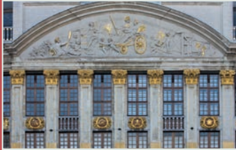
Zicht op het fronton van het huis van de hertogen van Brabant, Grote Markt 13-19 in Brussel, waarvan de verfraaiing werd verzorgd door L.-B. Dewez, in opdracht van de stad Brussel. De beelden zijn van Adrien Anrion.