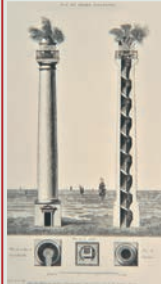
Plannen, doorsnede en opstand.