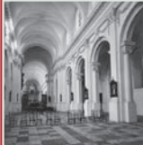
Zicht op het koor (1902 © KIK-IRPA, Brussel).