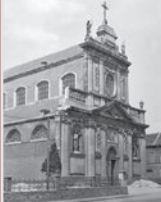
Zicht op de hoofdgevel (1942).