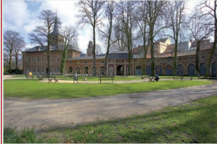
Zicht op de halfcirkelvormige arcades die het oude voorplein en het oude woonvolume vormen (2006).