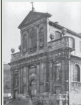
Zicht op de hoofdgevel van de kerk Sainte-Begge in Andenne (1914-1918).