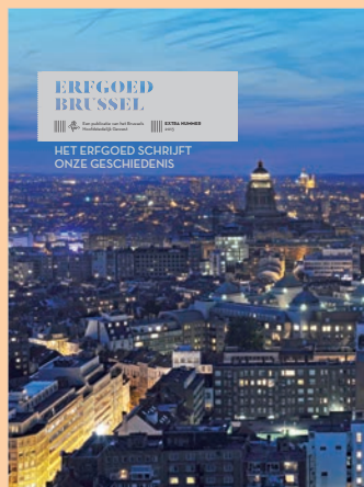
ERFGOED BRUSSEL EXTRA NUMMER 2013 HET ERFGOED SCHRIJFT ONZE GESCHIEDENIS