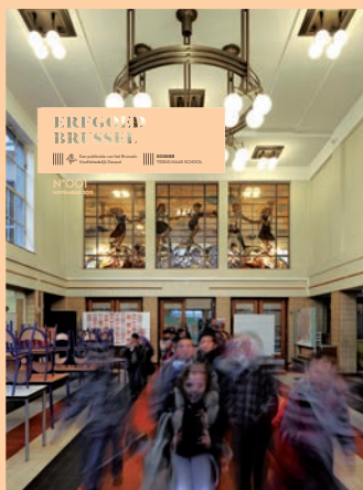
ERFGOED BRUSSEL 001 NOVEMBER 2011 TERUG NAAR SCHOOL