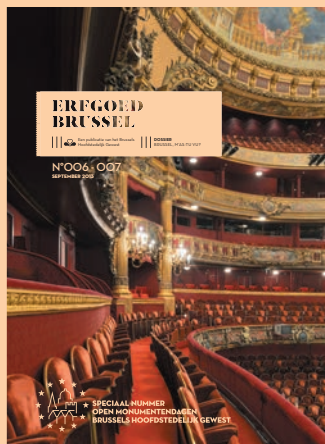
ERFGOED BRUSSEL 006-007 SEPTEMBER 2012 BRUSSEL, MAS-TU VU ?