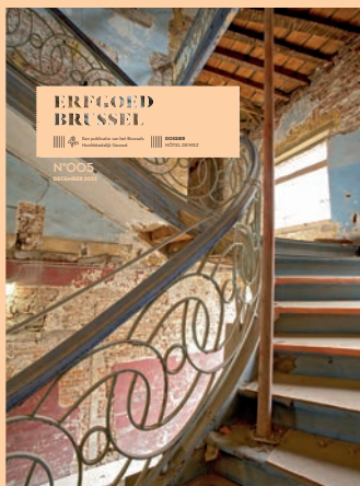
ERFGOED BRUSSEL 005 DECEMBER 2012 HÔTEL DEWEZ