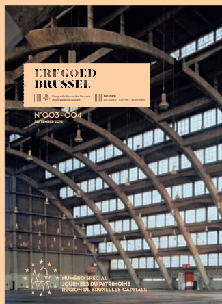
ERFGOED BRUSSEL 003-004 SEPTEMBER 2012 DE KUNST VAN HET BOUWEN