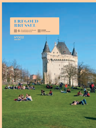
ERFGOED BRUSSEL 002 JUNI 2012 DE HALLEPOORT